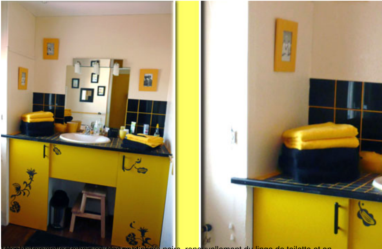
On a redécoré la salle de bain avec des accessoires noirs, renouvellement du linge de toilette et on