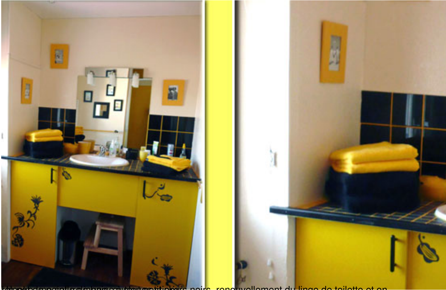
On a redonné sa teinte aux carreaux noirs, renouvellement du linge de toilette et on